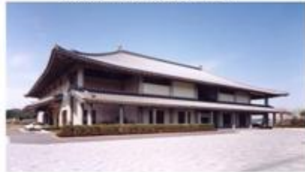
【大分市歴史資料館】